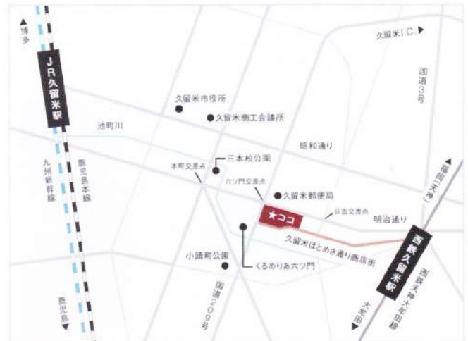
久留米シティプラザ周辺地図