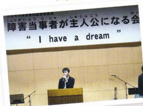
写真：昨年度の様子